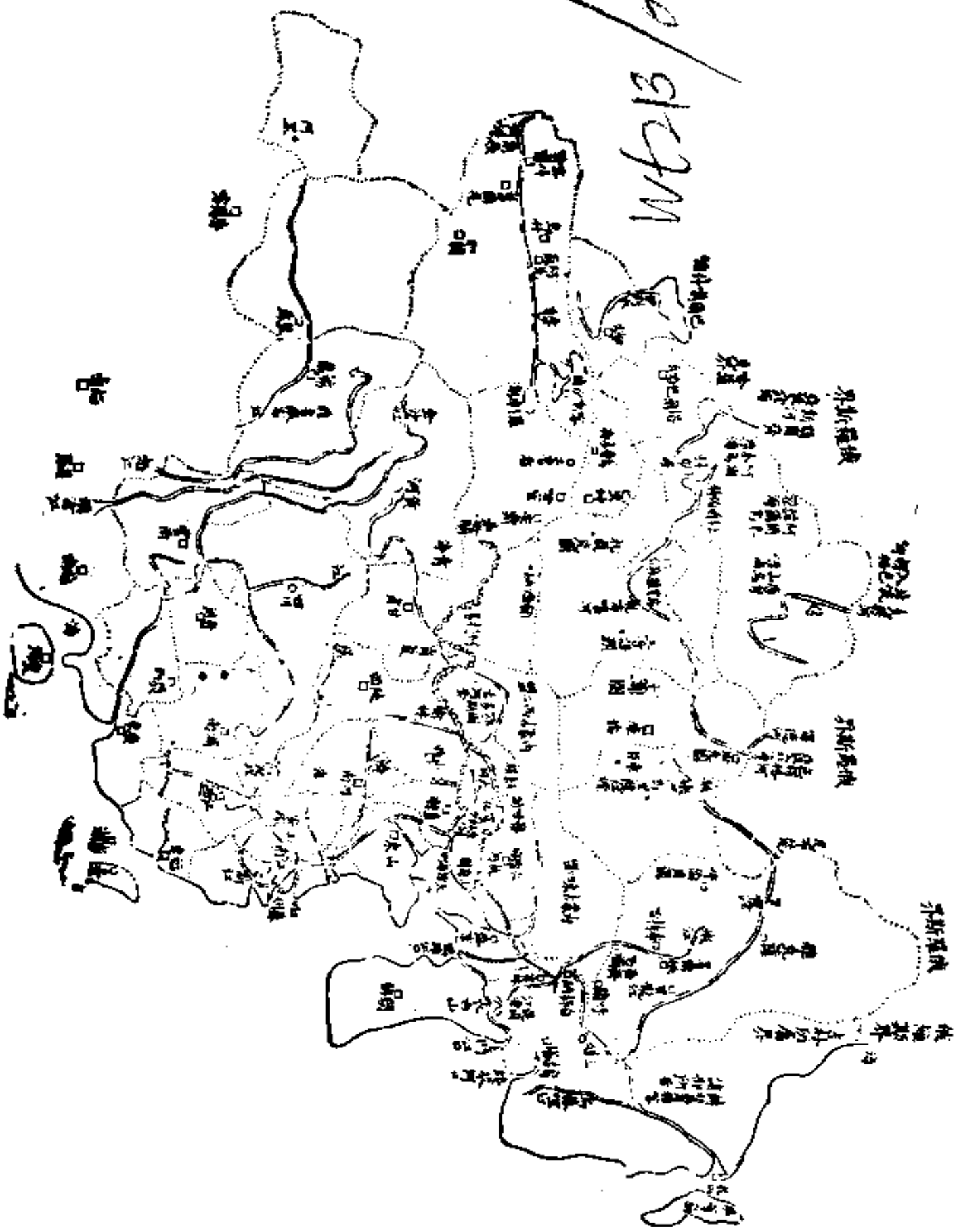
道光中未圖地圖自何秋澍備皇全圖

20/21/22/23/24/25/26/27/28/29/30/31/32/33/34/35/36/37/38/39/40/41/42/43/44/45/46/47/48/49/50/51/52/53/54/55/56/57/58/59/60/61/62/63/64/65/66/67/68/69/70/71/72/73/74/75/76/77/78/79/80/81/82/83/84/85/86/87/88/89/90/91/92/93/94/95/96/97/98/99/100